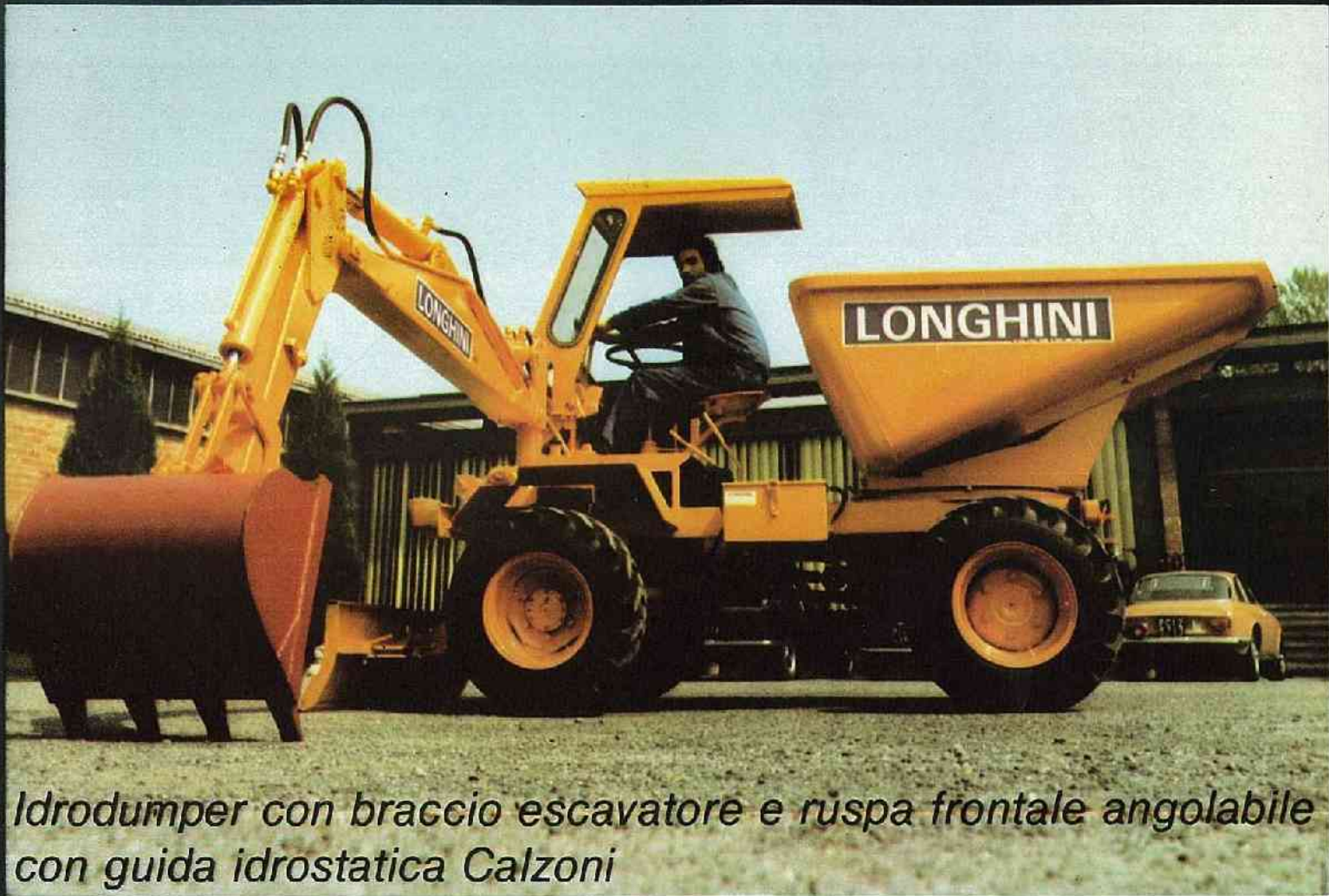
Idrodumper con braccio escavatore e ruspa frontale angolabile con guida idrostatica Calzoni

Omologato per la circolazione stradale - Completamente idraulico - massima resa economica - PRESTAZIONI: Polivalente per escavazione - riempimento - Spianamento - carico e trasporto